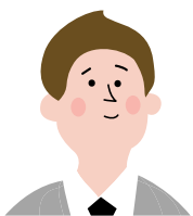
10년 차 어세스타 연구원 김OO

학교에서 '모범생'이라고 불리는 것보다 내 삶의 '주인공'이 되고싶은 학생들을 위한 심리검사입니다.